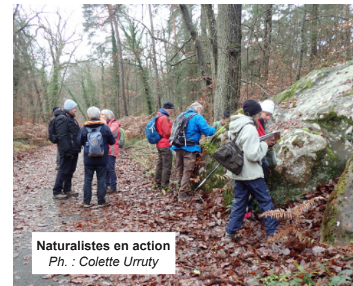
Naturalistes en action