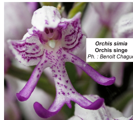
Orchis simia Orchis singe

ANVL, Association des Naturalistes de la Vallée du Loing et du massif de Fontainebleau Station d'écologie forestière, Route de la tour Denecourt, 77300 Fontainebleau Tel. : 01.64.22.61.17 Courriel : anvl@anvl.fr Site : www.anvl.fr