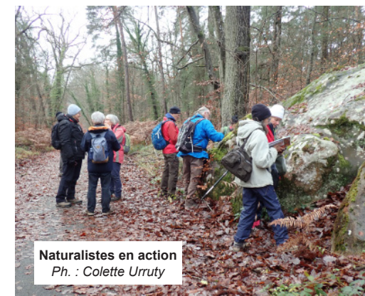
Naturalistes en action