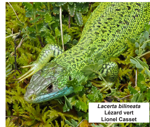
Lacerta bilineata Lézard vert Lionel Casset