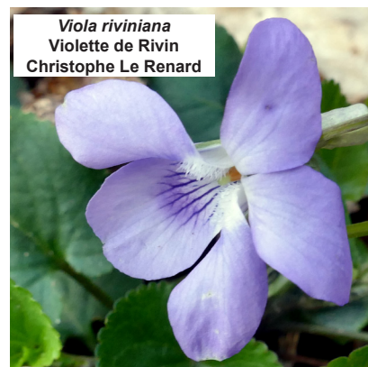
Viola riviniana Violette de Rivin Christophe Le Renard

ANVL, Association des Naturalistes de la Vallée du Loing et du massif de Fontainebleau Station d'écologie forestière, Route de la tour Denecourt, 77300 Fontainebleau Tel. : 01.64.22.61.17 Courriel : anvl@anvl.fr Site : www.anvl.fr