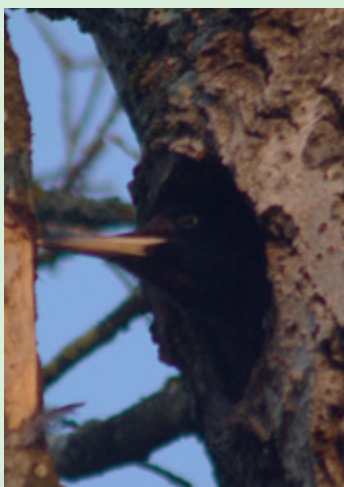
Pic noir dans sa loge