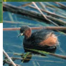
Le Grèbe castagneux pêche dans les eaux profondes mais niche dans les roseaux sur les berges.

Ce site, très attractif pour les oiseaux, a déjà permis d'observer plus de 120 espèces différentes dont plusieurs espèces rares qui ont choisi le site pour nicher ou pour passer l'hiver ou encore comme reposoir lors des périodes de migrations.