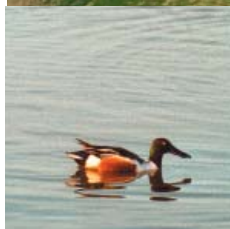
Les canards de surface, comme le Souchet, s'observent dans les zones de hauts fonds.