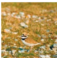
Le Petit Gravelot, visiteur d'été, niche sur les îlots de sables.

placé sous votre responsabilité, avec l'aide de généreux mécènes et les subventions de l'AEV, de l'AESN et de la Fondation du Patrimoine.