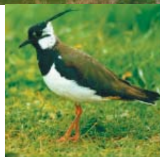
Le Vanneau niche dans les prairies humides autour du plan d'eau.